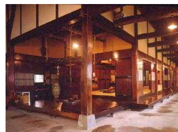
酒蔵資料館 東光の酒蔵

米沢藩御用達の造り酒屋。創業は慶長二（1597）年、四百年以上の歴史を誇る老舗です。江戸時代、米不足の年は藩中にたびたび禁酒令が出されましたが、この家だけは例外として酒造りを許されていたとか。往事を再現した酒蔵を見学した後には、もちろん試飲も。季節限定の商品もあるそうです。